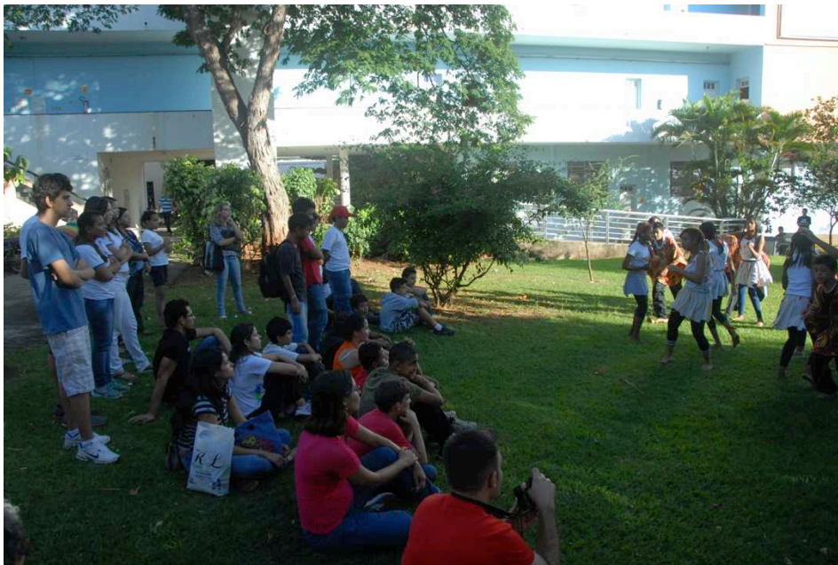
Fig. 4 - Performance A Travessia do Atlântico , nos jardins do Museu Antropológico realizada por alunos da Escola Municipal Professora Silene de Andrade, no dia da abertura da exposição Olhares - A Escola Ocupa o Museu . 15/07/2013