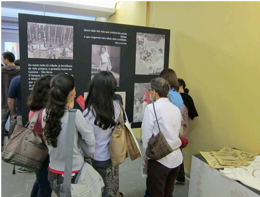
Fig. 2 - Abertura da exposição Ocupe o Museu Memórias de Goiânia , 17/05/2012