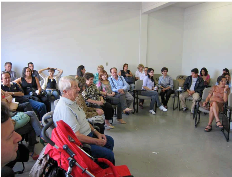
Fig. 3 - Roda de conversa com os moradores do entorno do Museu Antropológico, construtores da exposição Ocupe o Museu Memórias de Goiânia . 17/05/2013